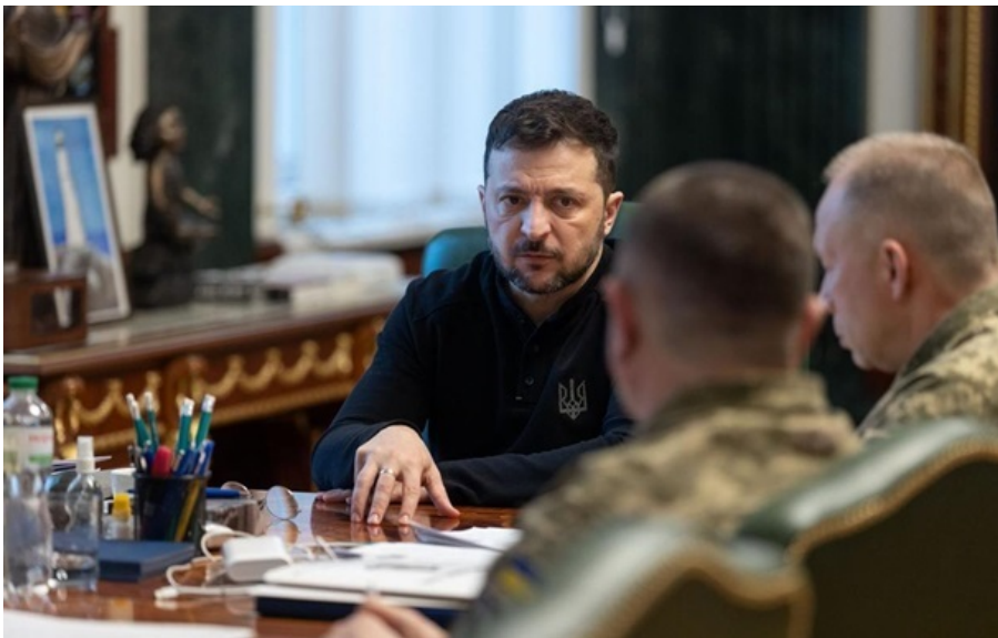
Президент скликає військових, аби підготувати відповідь для РФ