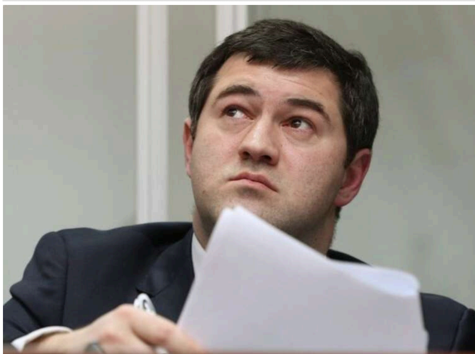
Апеляція ВАКС частково змінила вирок Роману Насірову та постановила стягнути понад 11 мільйонів гривень шкоди

Апеляційна палата Вищого антикорупційного суду частково змінила вирок колишньому голові Державної фіскальної служби Роману Насірову