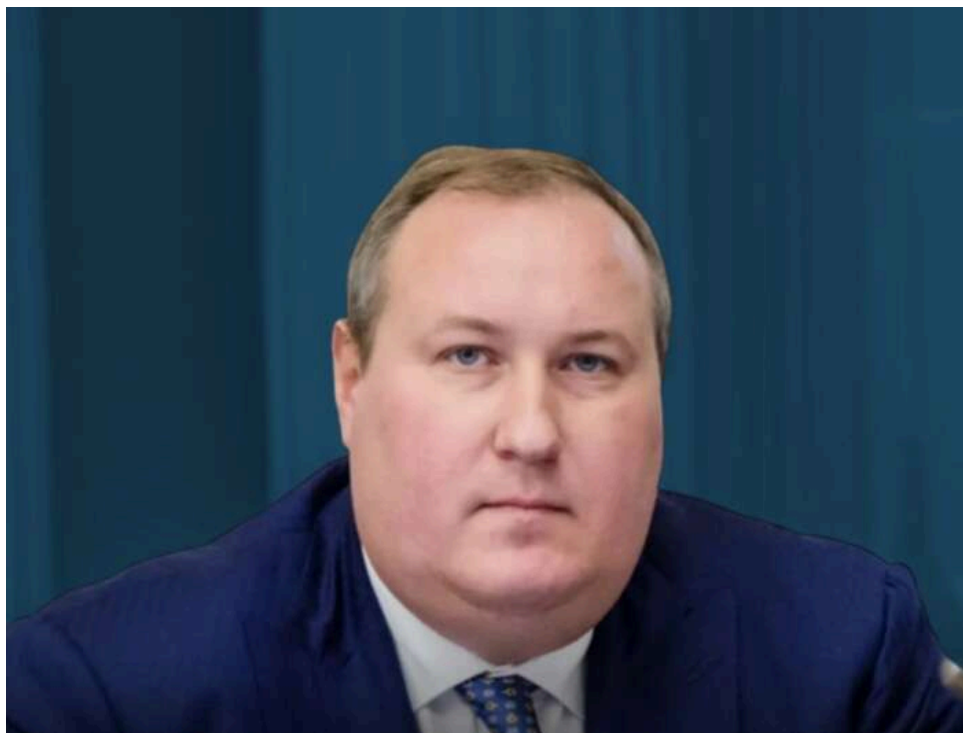
Небезпечний прецедент: ВРП покарала суддів ВАКС за заваду Печерському суду втрутитися у справу НАБУ