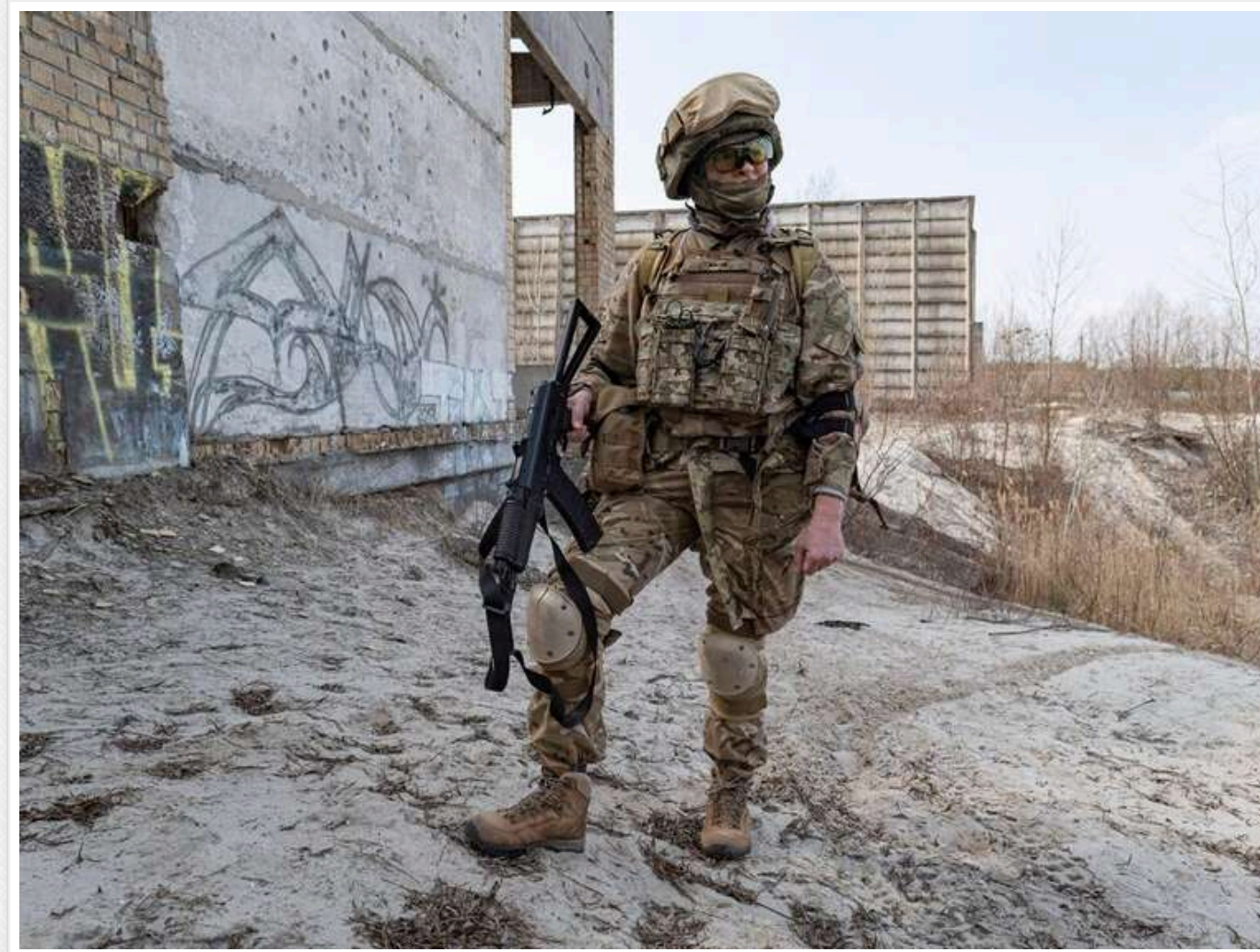
Загроза напівоточення Сум чи маніпуляція: У ЗСУ спростували заяву журналістки про критичну ситуацію в області

Журналістка попередила про ризик напівоточення Сум. ЗСУ спростовують цю інформацію.