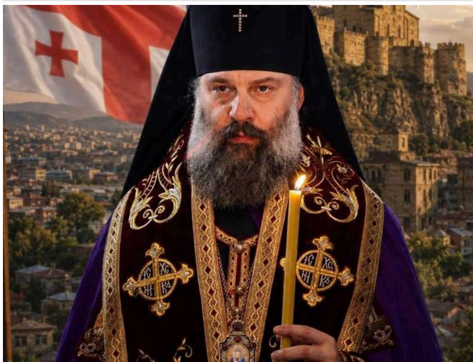
Кінець епохи Іллі II: у Грузії обрали нового патріарха православної церкви

У Грузії обрали нового патріарха Грузинської православної церкви після кончини Іллі II, який очолював Грузинську православну церкву на посаді католикоса-патріарха всієї Грузії майже 50 років.