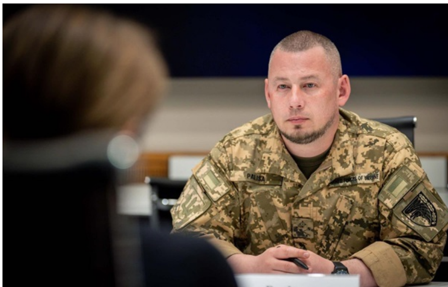
Павло Паліса під час переговорів з делегацією корпорації RTX

Нещодавно було підписано угода про постачання ракет PAC-2 GEM-T. Частина з них мають виробляти на новому підприємстві в Німеччині, зазначив Павло Паліса.