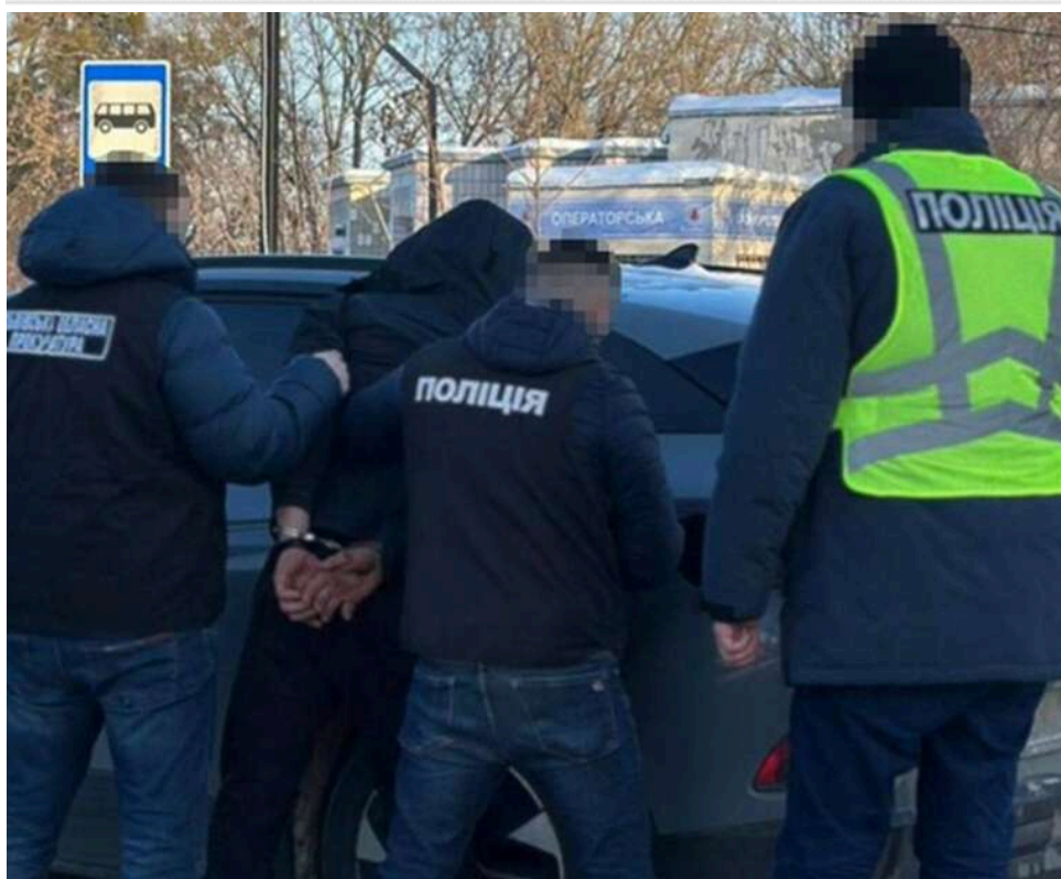
Майже пів мільйона за втечу до Молдови: на Львівщині судитимуть чоловіка за організацію схеми переправлення ухлянтів через кордон

На Львівщині судитимуть 29-річного жителя Рівненщини, якого обвинувачують в організації схеми незаконного переправлення чоловіків через кордон. За даними слідства, він обіцяв за 10 тисяч доларів допомогти львів'янину потрапити до Молдови поза пунктами пропуску.