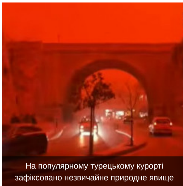
Фото та Відео

На популярному турецькому курорті зафіксовано незвичайне природне явище