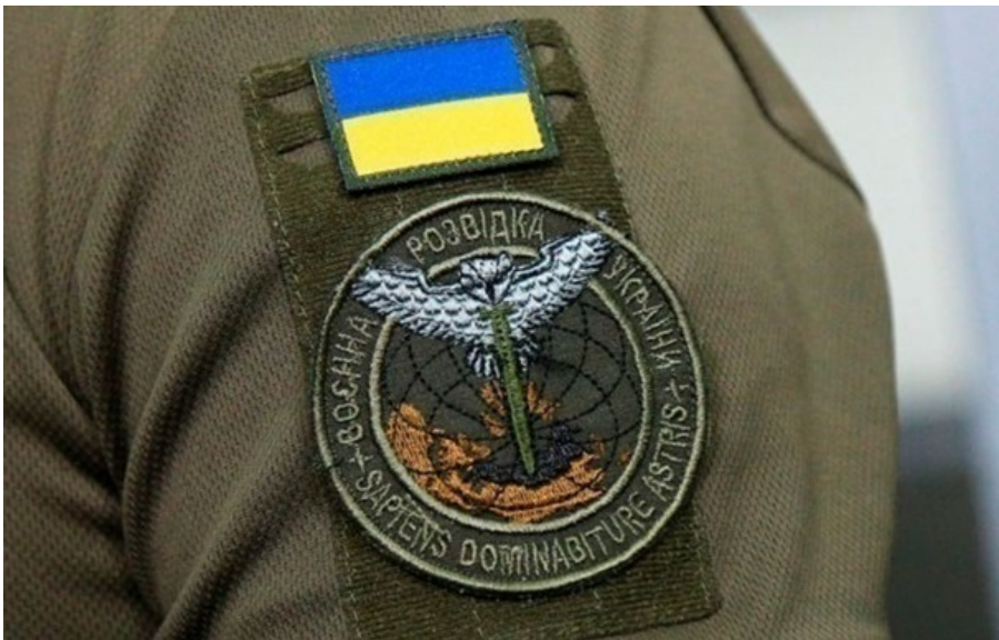
ГУР розкрило дані фігурантів воєнних злочинів

ГУР оприлюднило персональні дані підозрюваних, серед яких троє колаборантів та один громадянин РФ.