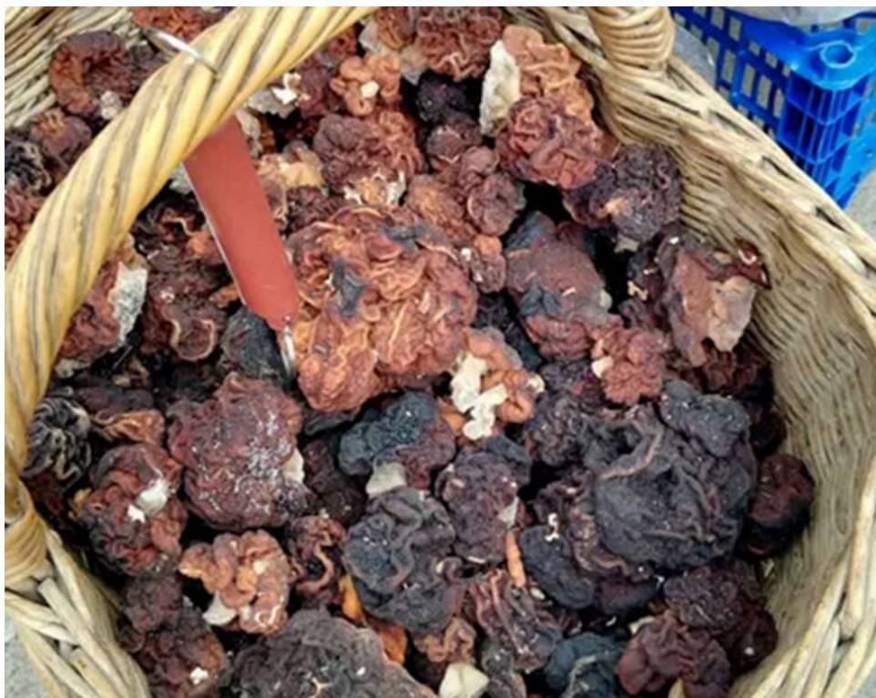
Смерть у кошику біля метро "Святошин": киянка зупинила продаж отруйних грибів, які торговець видавав за їстівні

Поруч зі станцією метро «Святошин» у Києві чоловік відкрито продав кошик строчків звичайних ( Boletus edulis ) – грибів, які становлять смертельну небезпеку для людини. Трагедії від отруєнь грибами на Київщині усім добре відомі: щороку люди гинуть через помилкове споживання таких грибів. Уважна киянка розпізнала отруйний гриб, підняла тривогу прямо біля продавця – перехожі почали збиратися навколо. Після погрози викликати поліцію торговець утік, але куди саме він пішов далі – невідомо.