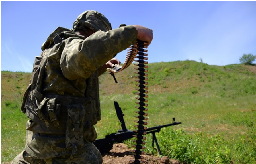
ЗСУ ведуть важкі бої на сході і півдні України

Найбільш активно ворог діє в районі Покровська, де зараз підрозділи ЗСУ відбивають чотири штурми.