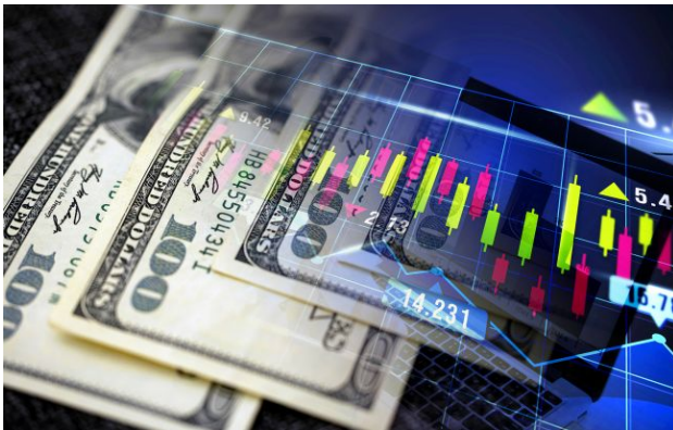
Фото: НБУ оновив офіційний курс валют на 12 травня

Обирайте перевірене - додайте РБК-Україна до улюблених джерел у Google