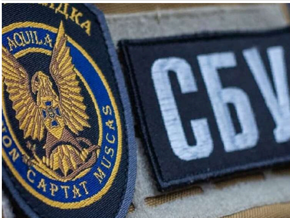
"Недостатньо шкоди": СБУ відмовила НАБУ в ініціюванні санкцій проти соратника Януковича Юрія Іванющенка

Служба безпеки України не виявила достатніх даних про шкоду в запиті Національного антикорупційного бюро щодо запровадження санкцій проти екснардепа від забороненої Партії регіонів Юрія Іванющенка.