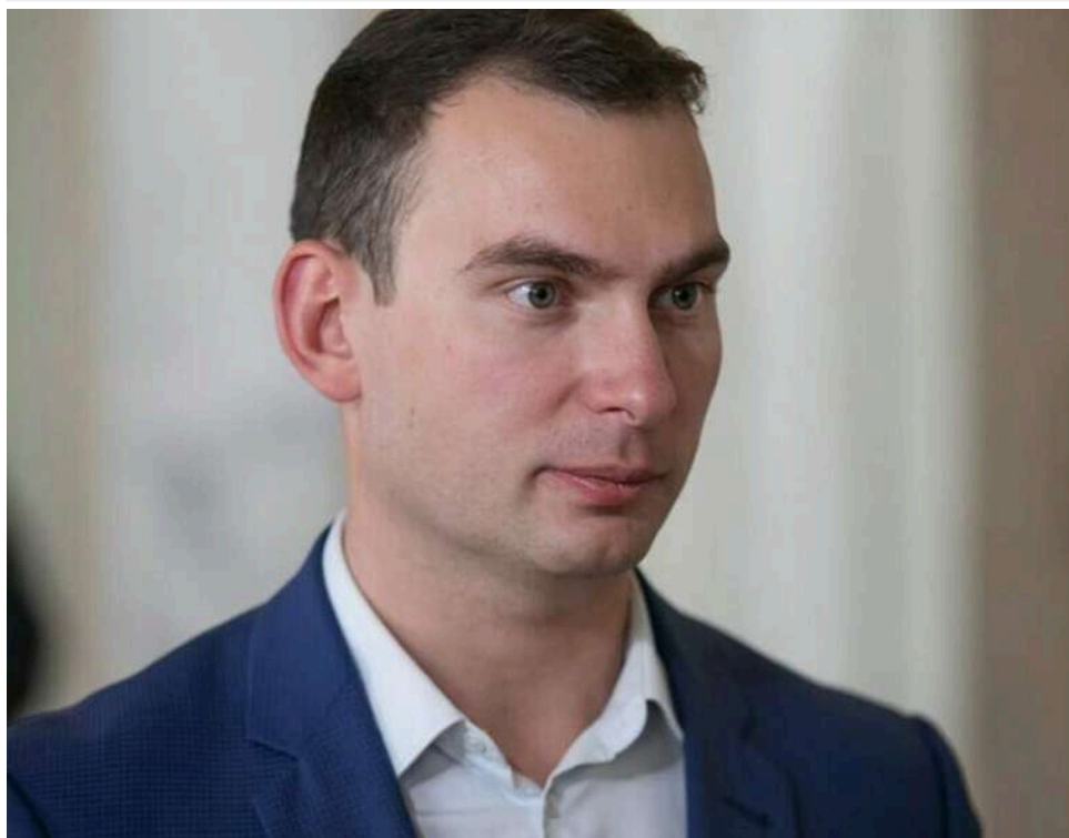
Санкції в обмін на голоси за бюджет: Нардеп заявив про обіцянку Зеленського не використовувати РНБО проти українців

Народний депутат Железняк, посилаючись на джерела, повідомив, що Зеленський пообіцяв депутатам припинити використання санкцій проти громадян України в політичних цілях.