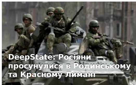
DeepState: Росіяни просунулися в Родинському та Красному Лимані