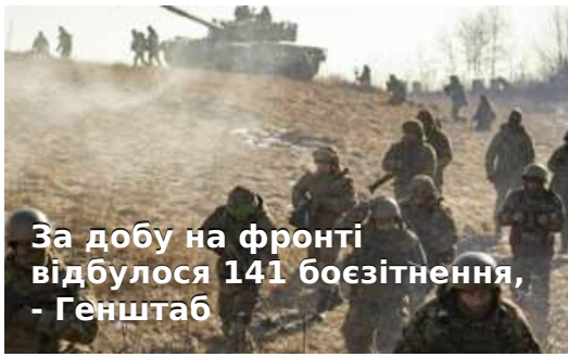
За добу на фронті відбулося 141 боєзітнення, - Генштаб