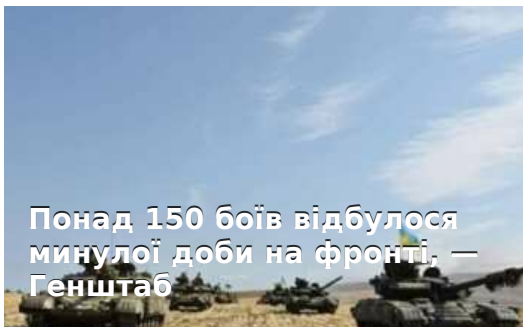
Понад 150 боїв відбулося минулої доби на фронті, — Генштаб