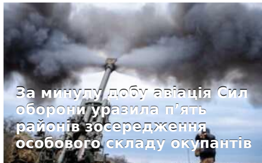
За минулу добу авіація Сил оборони уразила п'ять районів зосередження особового складу окупантів