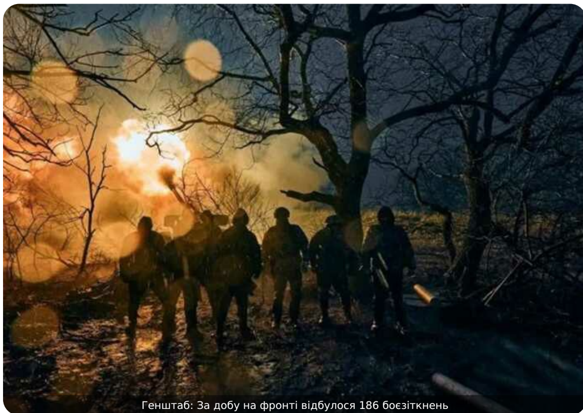
Генштаб: За добу на фронті відбулося 186 боєзіткнень

Розпочалася 1533 доба широкомасштабної збройної агресії Росії проти України. Загалом протягом минулої доби зафіксовано 186 бойових зіткнень.