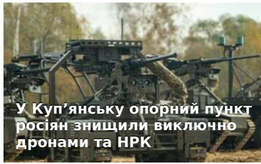
У Куп'янську опорний пункт росіян знищили виключно дронами та НРК