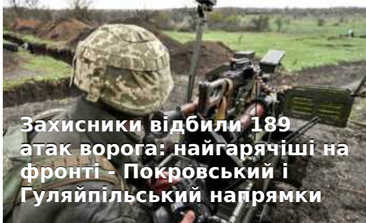
Захисники відбили 189 атак ворога: найгарячіші на фронті - Покровський і Гуляйпільський напрямки