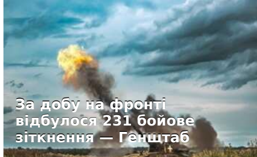
За добу на фронті відбулося 231 бойове зіткнення — Генштаб