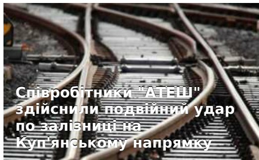
Співробітники "АТЕШ" здійснили подвійний удар по залізниці на Куп'янському напрямку