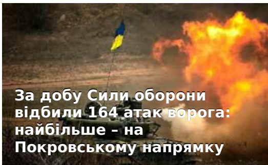
За добу Сили оборони відбили 164 атак ворога: найбільше - на Покровському напрямку