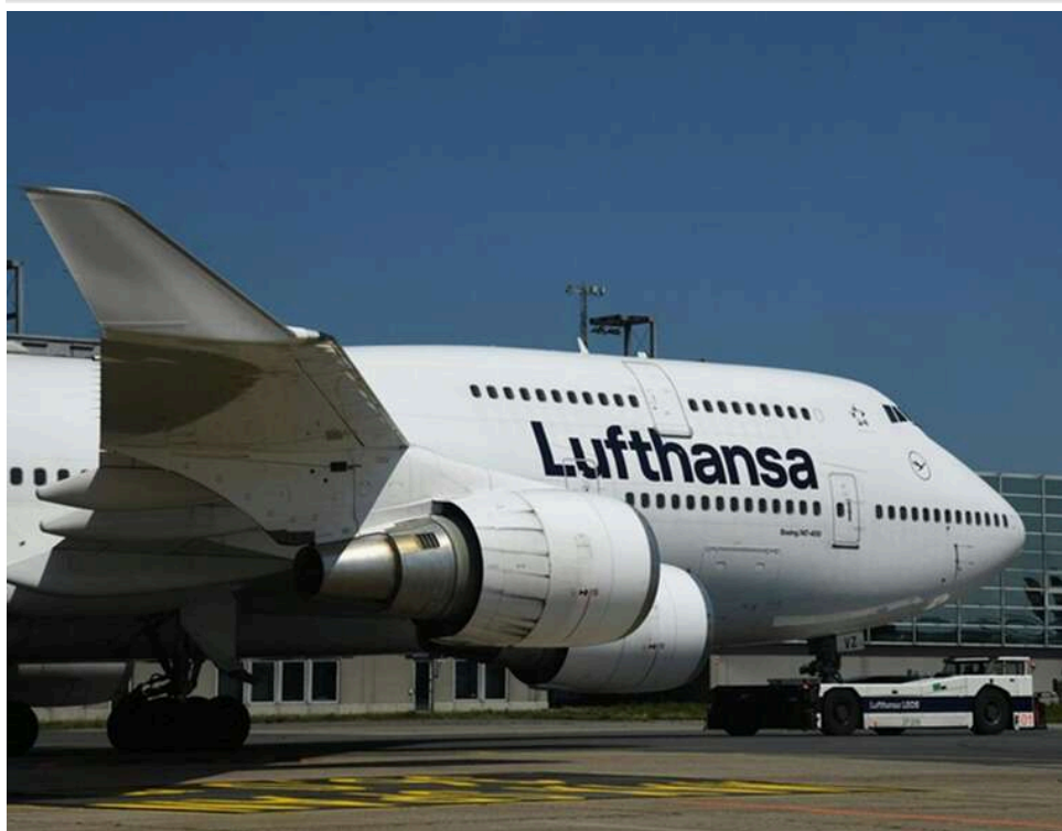
Паливна криза в небі: Lufthansa витратить додаткові 2 мільярди доларів на пальне через блокаду Ормузької протоки

Найбільшій авіакомпанії Європи, німецькій Lufthansa, знадобиться додатково два мільярди доларів на пальне цього року.