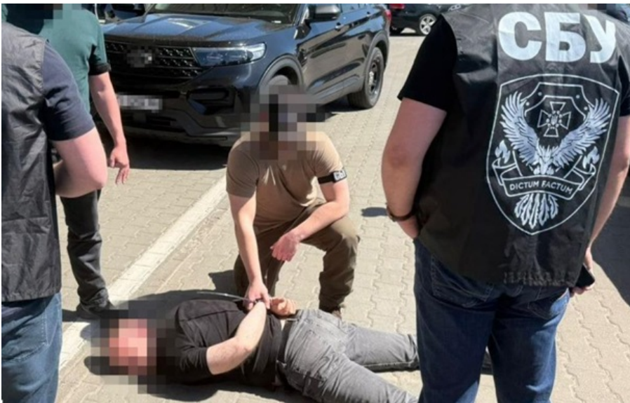
Нині вирішується питання запобіжного заходу