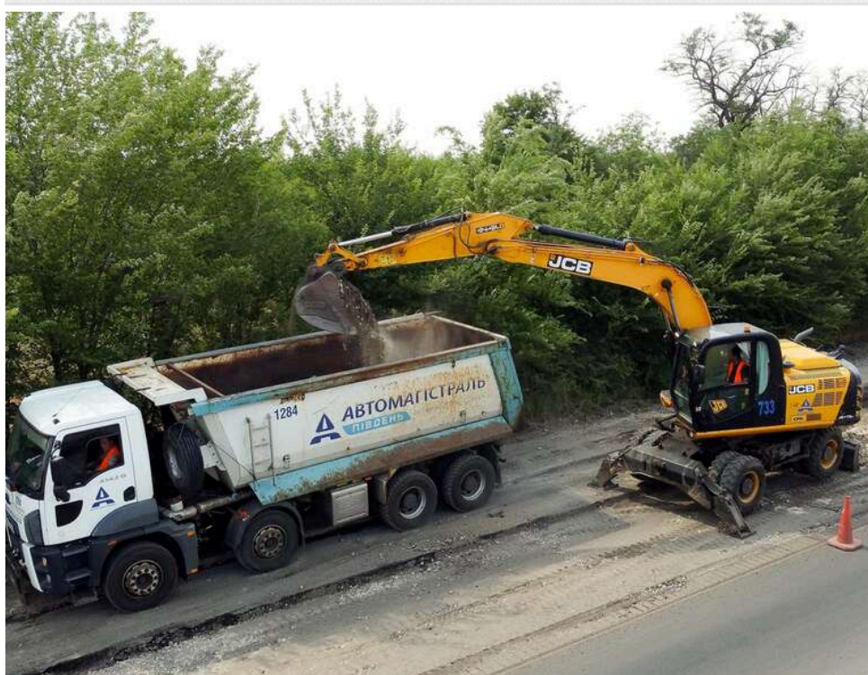
35 мільйонів за 2,5 кілометри: ремонт траси М-29 на Дніпропетровщині без тендеру віддали «Автомагістраль-Південь»

Служба відновлення та розвитку інфраструктури у Дніпропетровській області замовила ремонт ділянки дороги Харків – Красноград – Перещепине – Дніпро (М-29) за майже 35 мільйонів гривень.