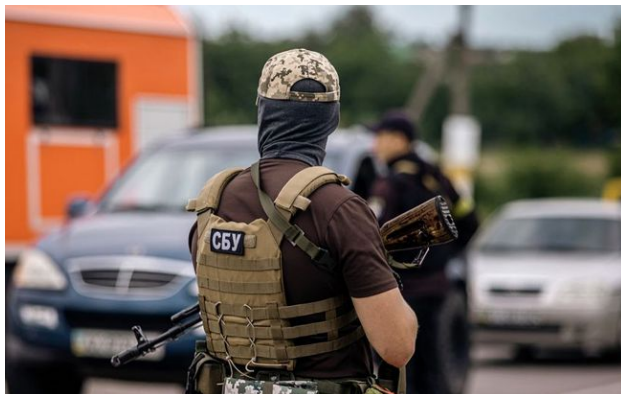
Фото: у Житомирі затримали керівника ТЦК

Обирайте перевірене - додайте РБК-Україна до улюблених джерел у Google