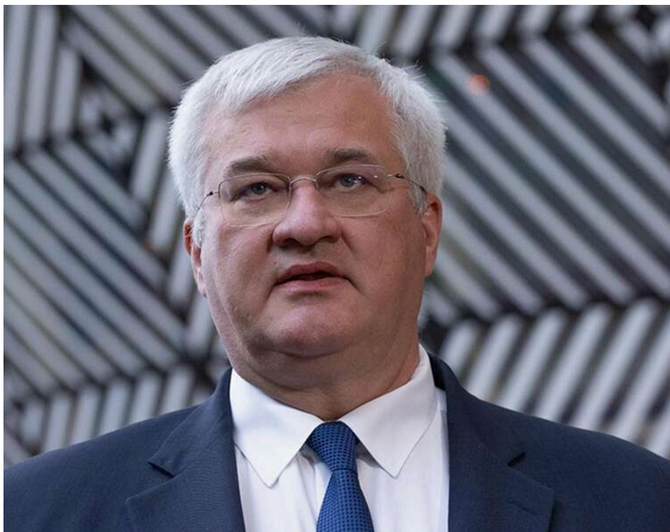
Перемир'я під вогнем: МЗС України заявило про масований обстріл РФ попри оголошений режим тиші

Глава МЗС Сібіга заявив, що Росія не дотримується оголошеного Зеленським припинення вогню, яке набуло чинності з цієї ночі.