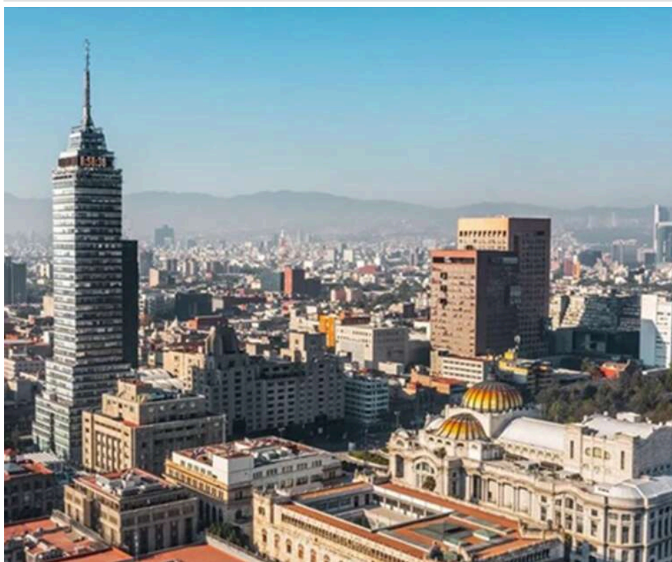
Місто, що йде під землю: NASA фіксує просідання Мехіко на 24 сантиметри щороку

Мехіко щорічно опускається приблизно на 24 сантиметри, що робить його одним із міст із найшвидшим просіданням ґрунту в світі, згідно з новими супутниковими даними NASA.