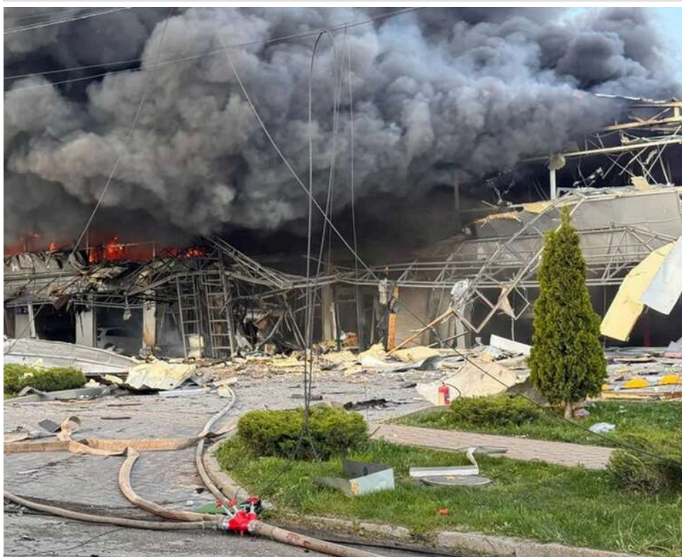
Удар РФ по Запоріжжю: 18 поранених залишаються в лікарнях, четверо – у важкому стані

У Запоріжжі зростає число постраждалих від російської терористичної атаки ввечері 5 травня. На ранок 6 травня в лікарнях міста лікуються 18 осіб.