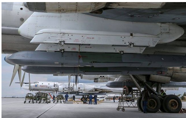
Фото: РФ модернізує Х-101 для ударів по Україні (росЗМІ)

Обирайте перевірене - додайте РБК-Україна до улюблених джерел у Google