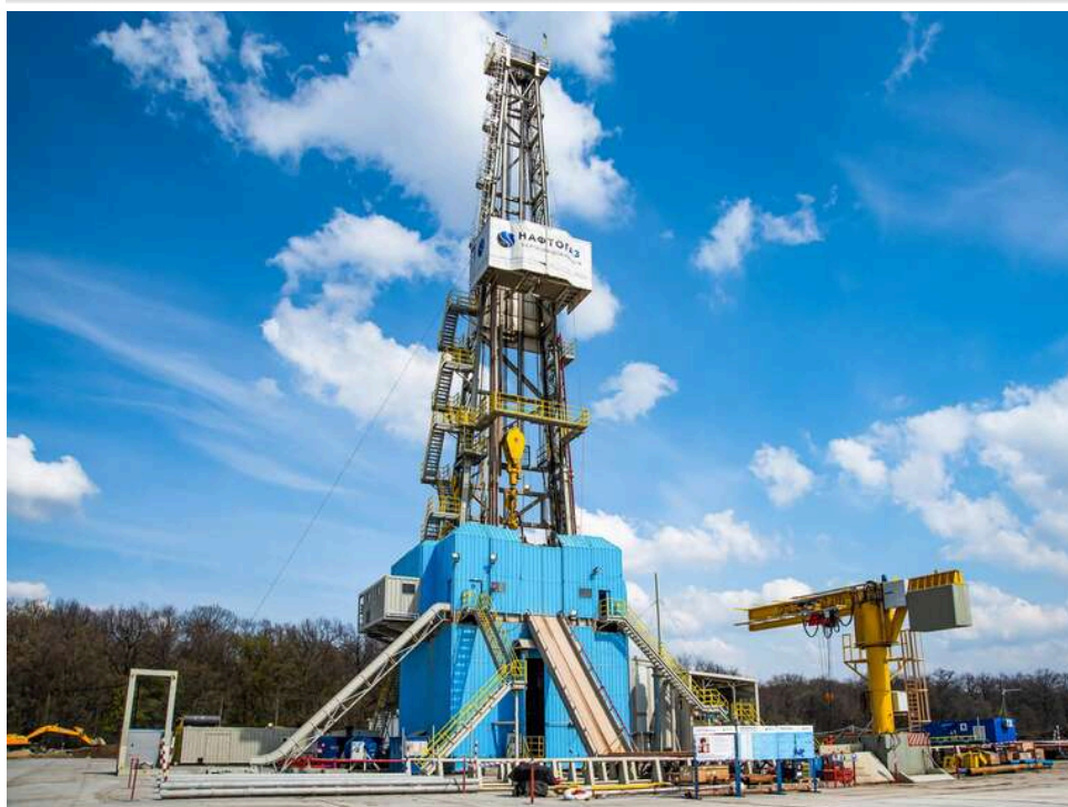
Мінус 11 мільйонів економії: як "Укргазвидобування" відсіяло найдешевшу заявку на тендері з цементу

Тендер на 113 млн грн: як «Укргазвидобування» відхилив найдешевшу заявку й прокладає шлях скандальній фірмі.