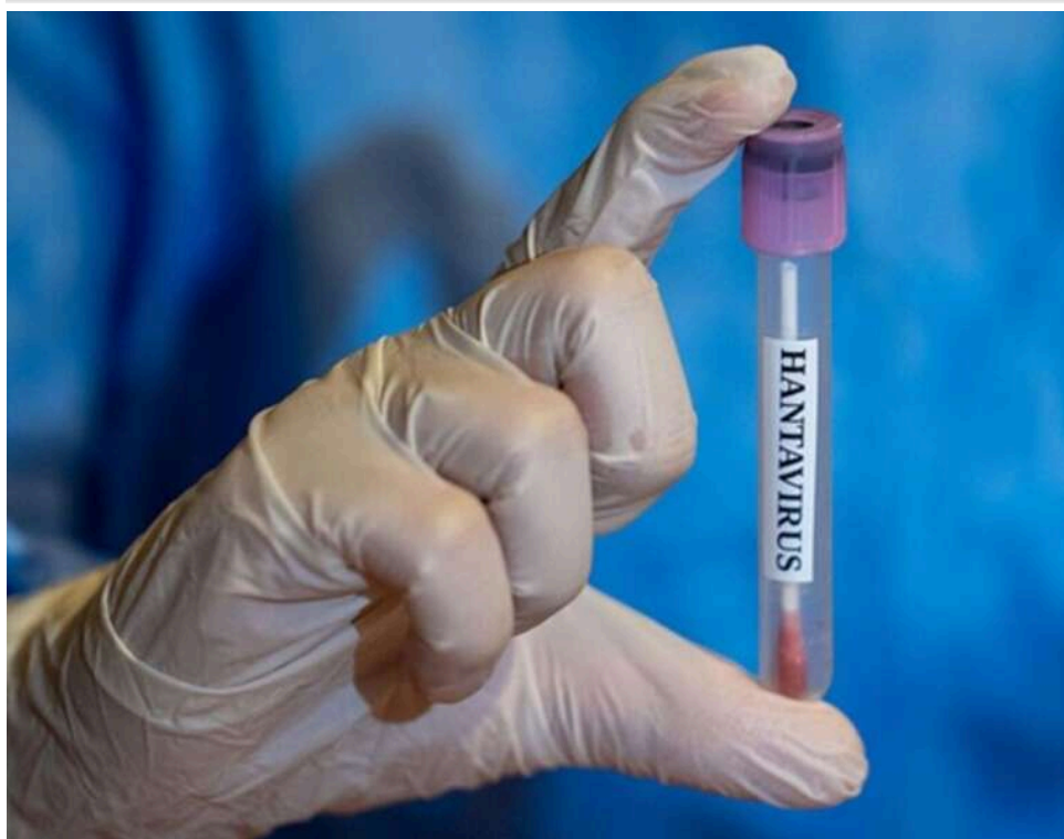
Брак грошей та рідкісні випадки: науковці пояснили, чому розробка вакцини проти хантавірусу триває десятиліттями

Вакцини та ефективного лікування проти хантавірусу досі не існує, попри те, що науковці працюють над цим уже десятиліттями.