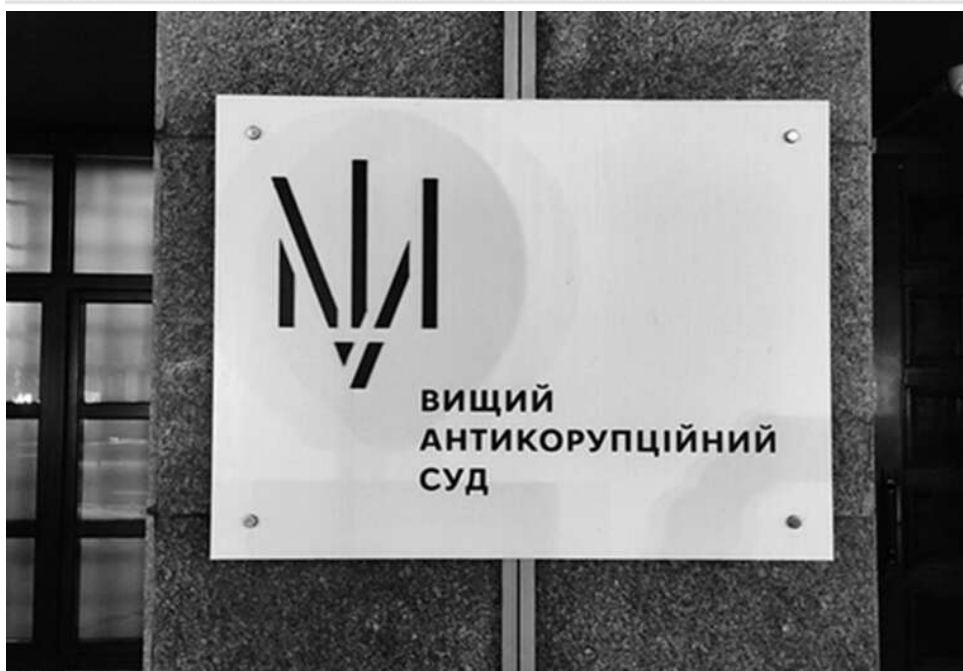
Донат замість тюрми: експрокурор з Ужгорода віддасть 1,2 мільйона ЗСУ за угоду у справі про шахрайство та переправлення через Тису

Вищий антикорупційний суд затвердив угоду в справі про шахрайство і підбурювання до замаху на надання неправомірної вигоди.