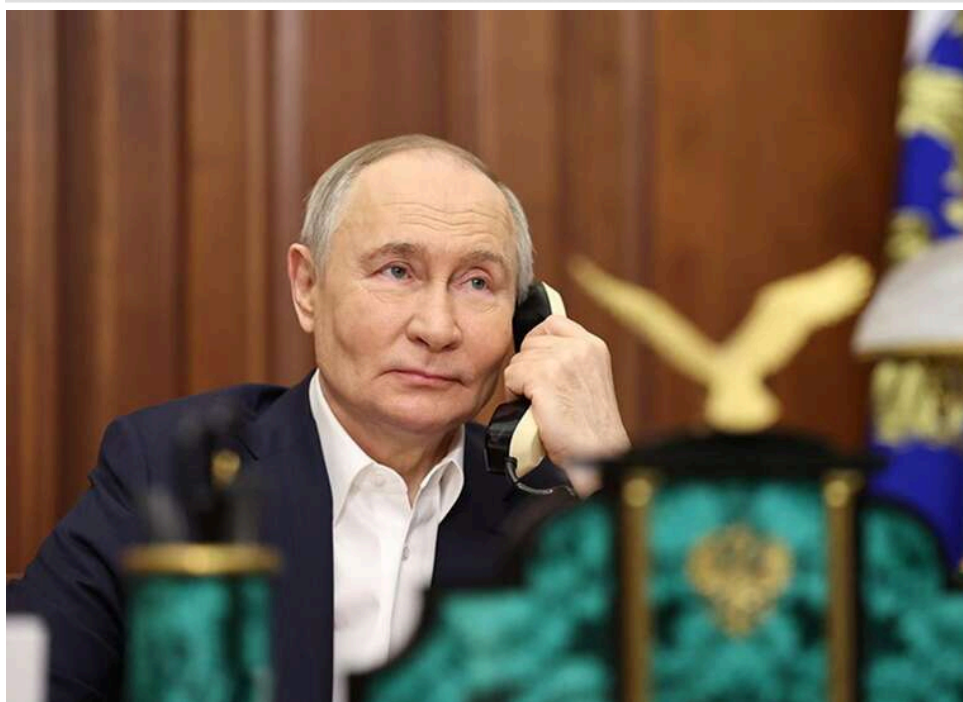
Плани Кремля руйнуються: У війні настав переломний момент – ініціатива перейшла до Києва, - The Economist

Зменшений парад у Москві на 9 травня продемонстрував невдачі Москви на полі бою та її страх перед зростаючою ефективністю далекобійних ударів України. Вперше за три роки ініціатива у війні, схоже, перейшла до Києва, вказують у журналі The Economist.