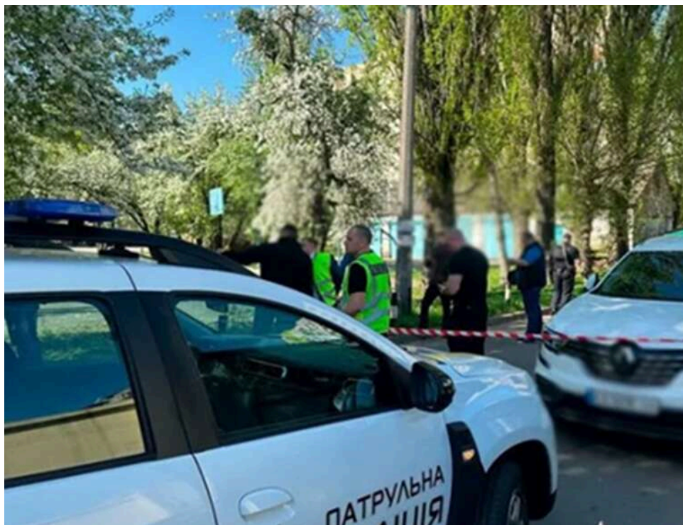
«Бігли по аптечку чи тікали?»: Голова Нацполіції пояснив дії патрульних під час стрілянини у Голосієві, ними зайнялося ДБР

Керівник Нацполіції Іван Вигівський описав послідовність подій інциденту зі стрілянини в Голосіївському районі Києва 18 квітня. Встановлено, що конфлікт розпочався через побутову суперечку: спочатку стрілець вистрелив у сусіда травматичним пістолетом, після чого повернувся до квартири, підпалив її та взяв бойову зброю. Водночас очільник Нацполу спробував виправдати патрульних, які ганебно втекли з місця події. Він стверджує, що насправді ніхто не тікав, а "бігуни" просто "йшли" по аптечку, щоб надати допомогу пораненій дитині.