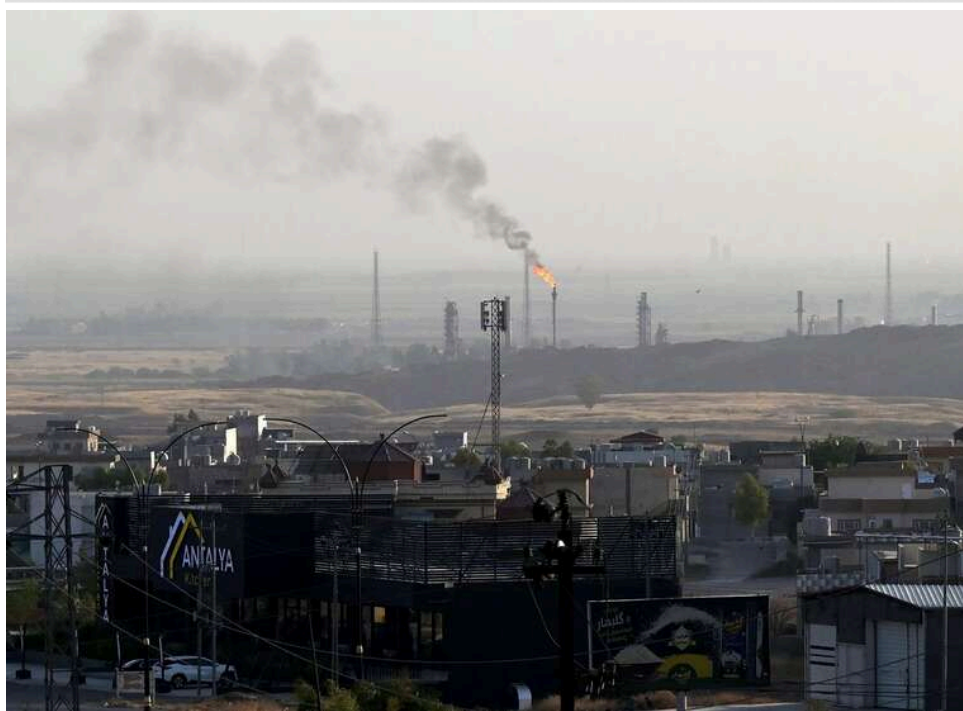
Нафта і газ різко подешевшали після заяви Ірану про відкриття Ормузької протоки, – Bloomberg

Світові ціни на нафту та природний газ різко впали після заяви Ірану про розблокування Ормузької протоки.