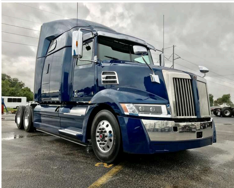
У США автономна фура вперше здійснила комерційний рейс без жодної людини в кабіні

У Сполучених Штатах сталося подія, яку вже багато хто проголошує початком нової ери у вантажних перевезеннях. Вперше повністю автономна вантажівка самостійно здійснила комерційний рейс – без водія в кабіні, без віддаленого оператора та без будь-якого людського втручання.