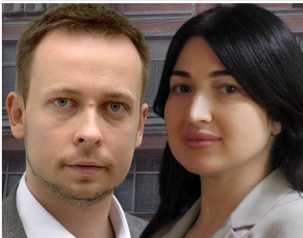
Експертиза за понад 2 мільйона гривень: як у ДніпроНДІСЕ під дахом Мін'юсту торгують доказами та "ховають" справи