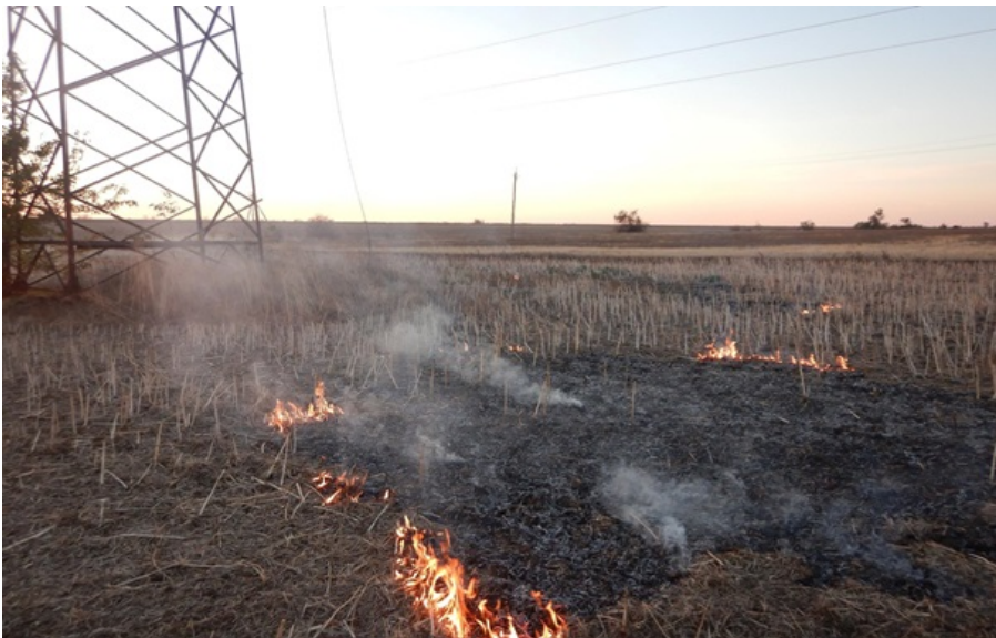
Пошкоджені мережі через російську атаку