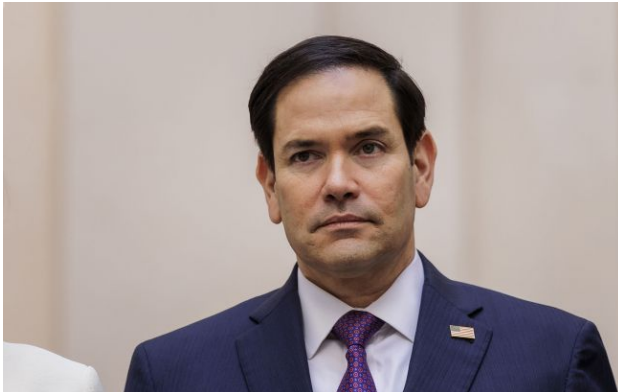
Фото: Марко Рубіо (Getty Images)

Обирайте перевірене - додайте РБК-Україна до улюблених джерел у Google