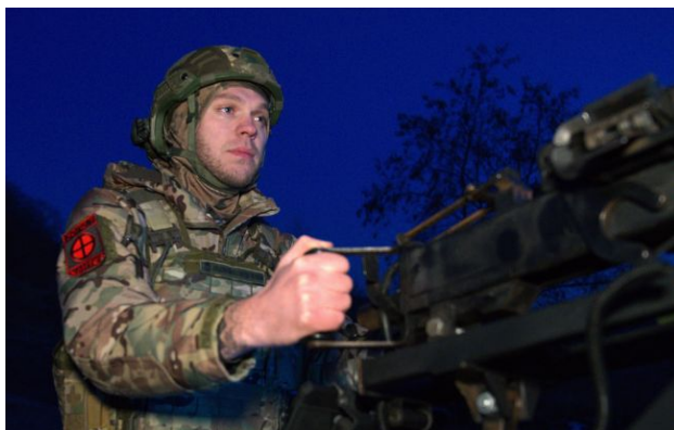
Фото: поки незрозуміло, чи були зафіксовані дрони запущені ще до того, як настав режим "тиші"

Обирайте перевірене - додайте РБК-Україна до улюблених джерел у Google