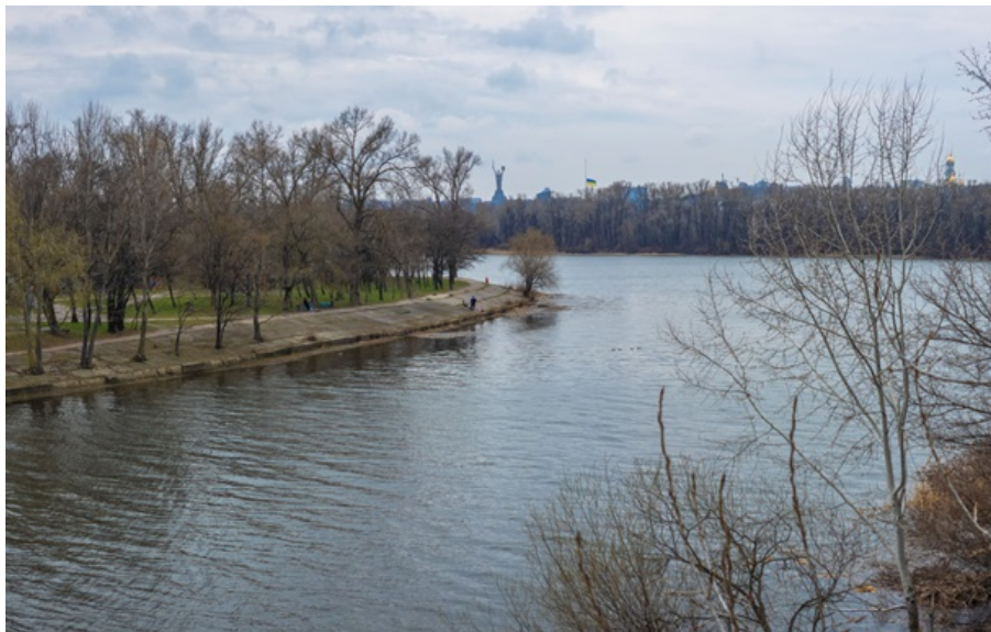
В Киеве в марте выпало всего 3% нормы осадков

Месяц стал одним из самых тёплых за всю историю наблюдений и самым сухим с 1891 года.