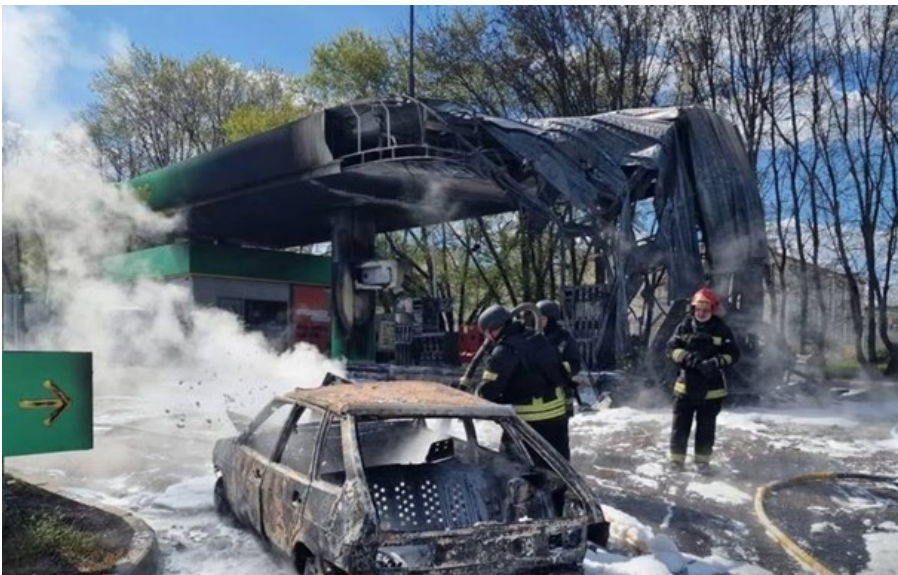
Фото: Харківська ОВА РФ цілиться по українських АЗС на відстані 20-25 км від лінії фронту

Станціям, що перебувають у безпосередній зоні ураження, потрібно накривати вразливі об'єкти захисними сітками.