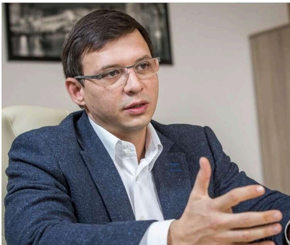
«Громадянський конфлікт» та заклики скласти зброю: СБУ оголосила нову підозру екснардепу Мураєву

СБУ оголосила про нову підозру екснардепу Мураєву, який заперечує збройну агресію РФ проти України.