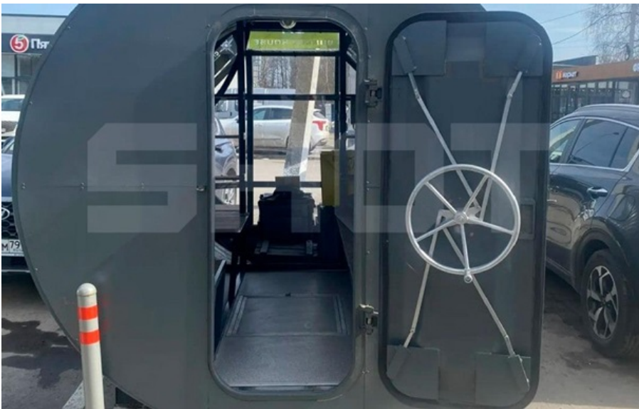
Базові рішення для бункера починаються від 2 млн рублів

Основними замовниками стали московські топ-менеджери та великі бізнесмени в Росії, що побоюються глобального конфлікту.