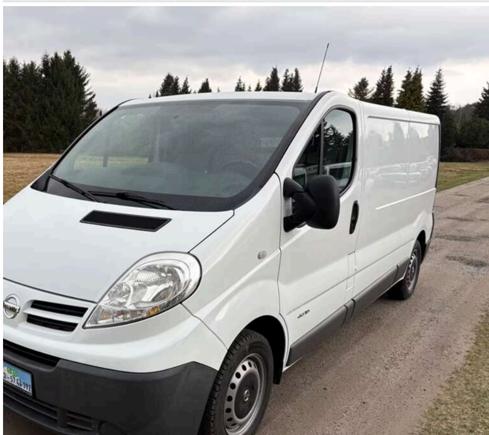
«Молочна аномалія» на сканері: на Львівщині жінку оштрафували за спробу провезти 324 літри молока з Польщі