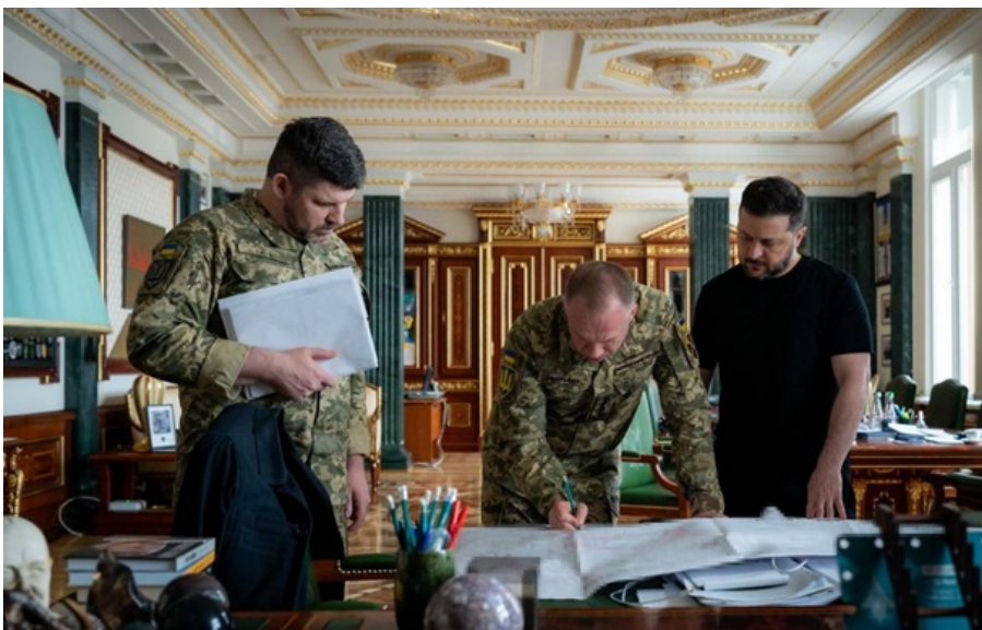
Фото: Пресслужба президента України Зеленський під час наради з Сирським і Гнативим 6 квітня

Важливо, щоб сильні українські позиції на фронті та в далекобійності працювали й на посилення позицій у дипломатії та в різнопланових відносинах із партнерами, підкреслив президент.