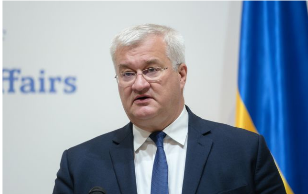
Фото: міністр закордонних справ України Андрій Сибіга

Обирайте перевірене - додайте РБК-Україна до улюблених джерел у Google