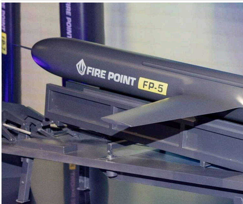
311 мільярдів в одні руки: як Fire Point монополізує половину оборонного бюджету України