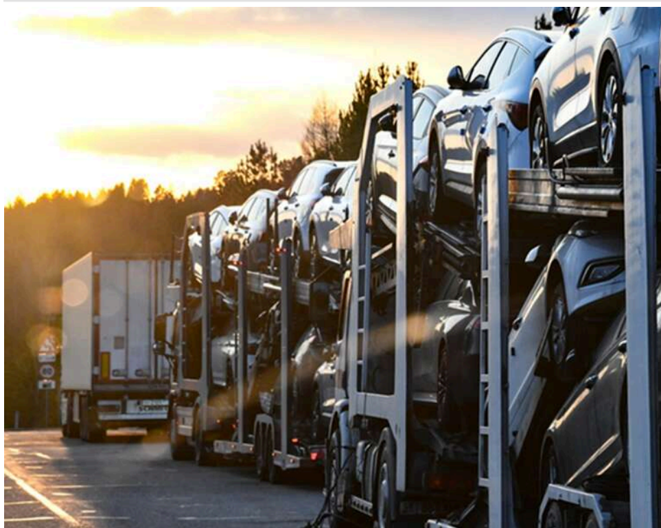
Суд оштрафував директорку волинської компанії на 250 тисяч гривень за махінації з митними сертифікатами

Схеми з автомобілями на 250 тис. грн: на Волині суд оштрафував керівницю ТОВ «КУПЕР СЕРВІС» через підроблені сертифікати EUR.1.