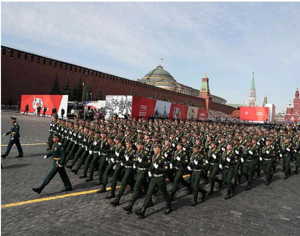
Парад без броні: у Москві пройшла друга репетиція 9 травня без участі військової техніки

У РФ відбулася друга репетиція параду Перемоги 9 травня, повідомляють російські пабліки.