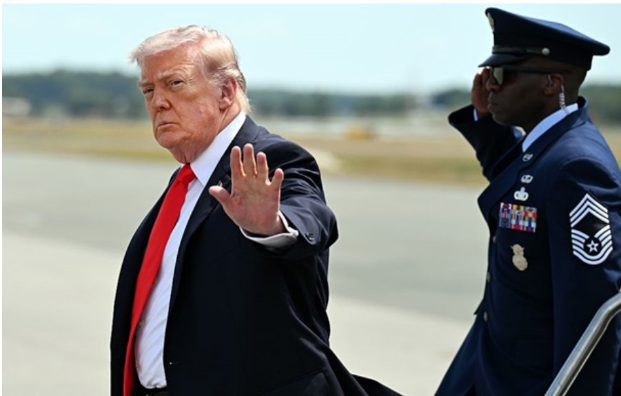
Трамп придумав план для Ормуза

Трамп заявив, що Іран буде “стертий з лиця Землі”, якщо атакує американські судна в рамках Проєкту Свобода.