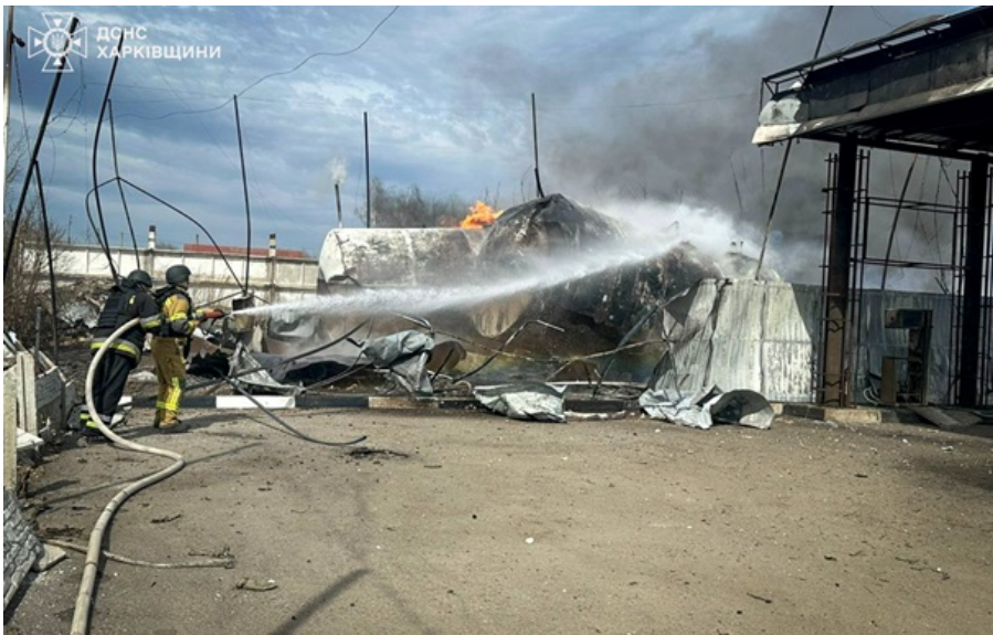
Рятувальники впоралися з займанням після атаки РФ

Внаслідок російського удару БПЛА сталося загоряння чотирьох резервуарів з паливом ємністю 10 та 25 куб. м