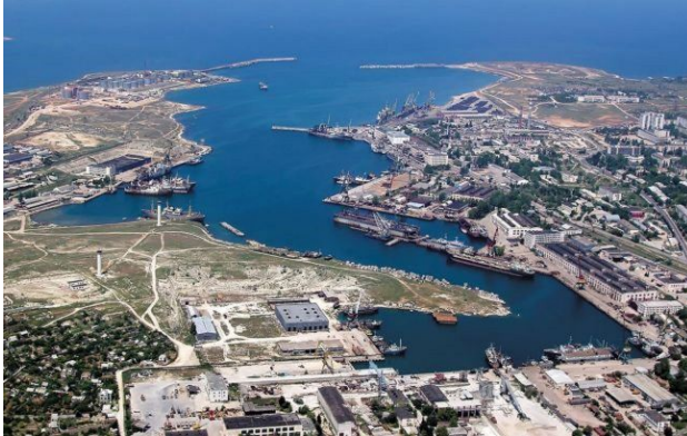
Фото: окупанти відмовились від проведення всіх масових заходів

Обирайте перевірене - додайте РБК-Україна до улюблених джерел у Google