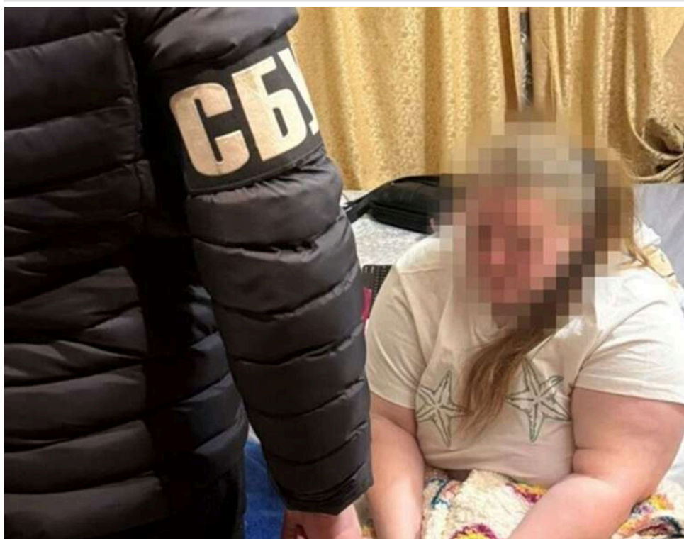
СБУ затримала російську агентку, яка готувала теракт проти військових у Житомирі

У Житомирі СБУ та Нацполіція затримали агентку РФ, яка планувала теракт проти військових. Жінка мала видати себе за кур'єра пошти та доставити вибухівку до адмінбудівлі.