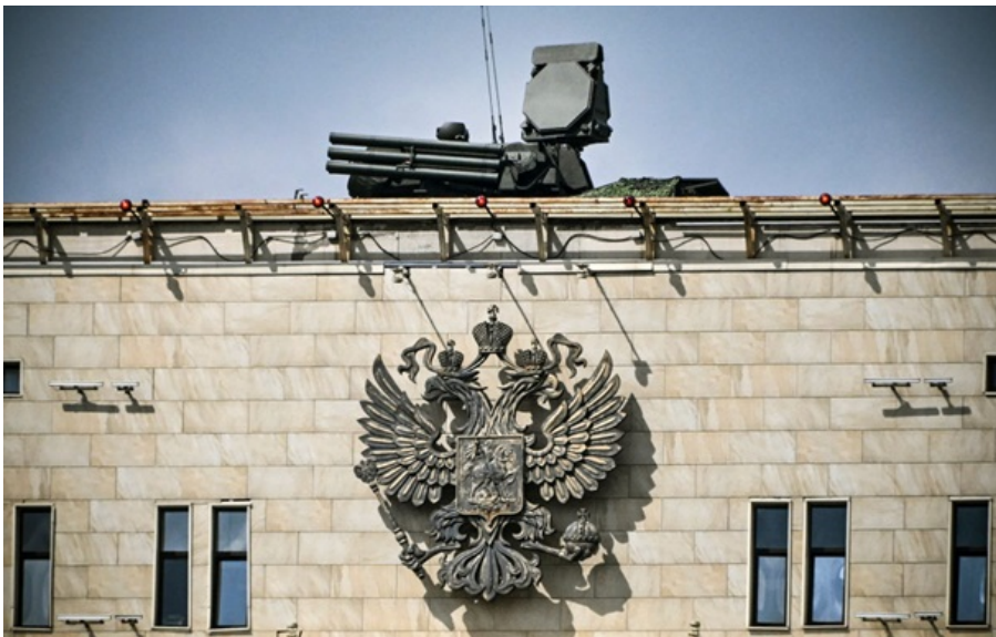
Росія концентрує ППО навколо Москви

Росія посилює протиповітряну оборону Москви та обмежує мобільний інтернет на тлі побоювань атак українських дронів напередодні параду 9 травня.