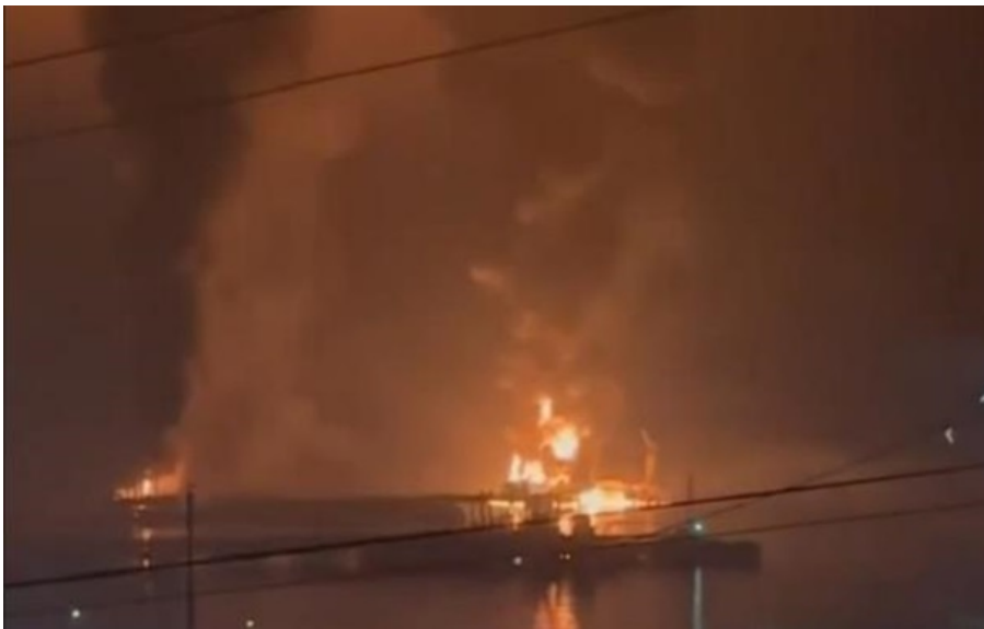
Пожежа в порту Новоросійська в ніч на 6 квітня

Пошкоджено трубопровід виносного причального пристрою та зливо-наливний причал, а також сталося загоряння чотирьох резервуарів із нафтопродуктами, заявили у Москві.